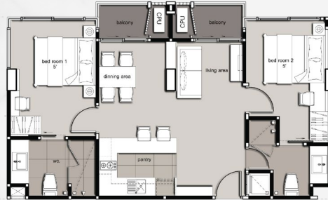
แบบ B1 2 ห้องนอน: 64 ตร.ม.