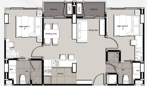
แบบ B2 2 ห้องนอน: 64 ตร.ม.