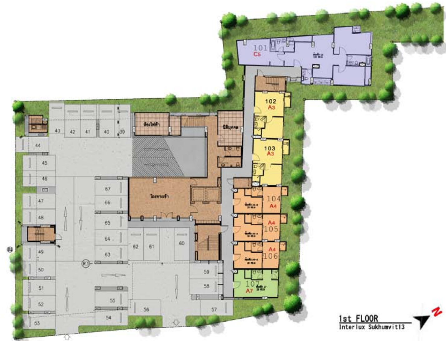
1st FLOOR Interlux Sukhumvit13