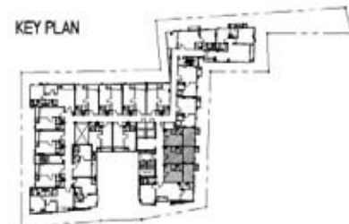
A4 30.00 sq.m. Interlux Sukhumvit13