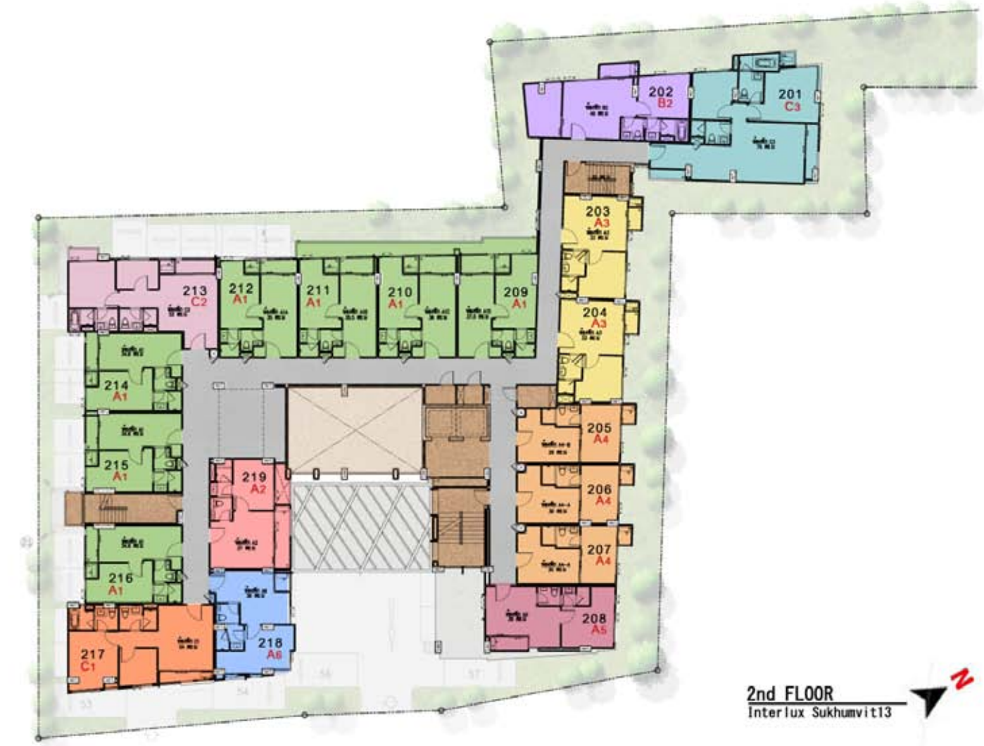
2nd FLOOR Interlux Sukhumvit13