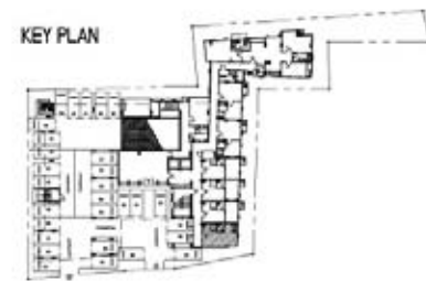
A7 28.00 sq.m. Interlux Sukhumvit13