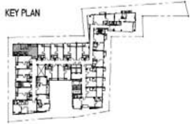
C2 52.00 sq. m. Interlux Sukhumvit13