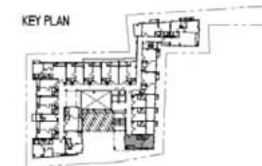
A5 39.00 sq.m. Interlux Sukhumvit13