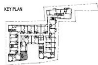
A6 36.00 sq.m. Interlux Sukhumvit13