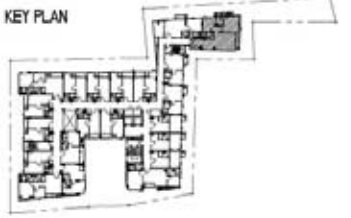
C3 75.00 sq. m. Interlux Sukhumvit13